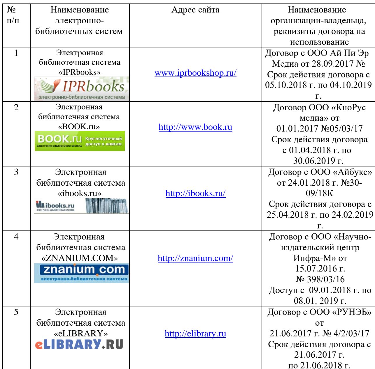
Таблица 1 - Сведения о наличии электронно-библиотечных систем:

Библиотека филиала уделяет большое внимание пропаганде и популяризации электронных информационных ресурсов. Умение работать с информационными потоками, электронными каталогами, электронными ресурсами библиотеки призвано способствовать повышению уровня